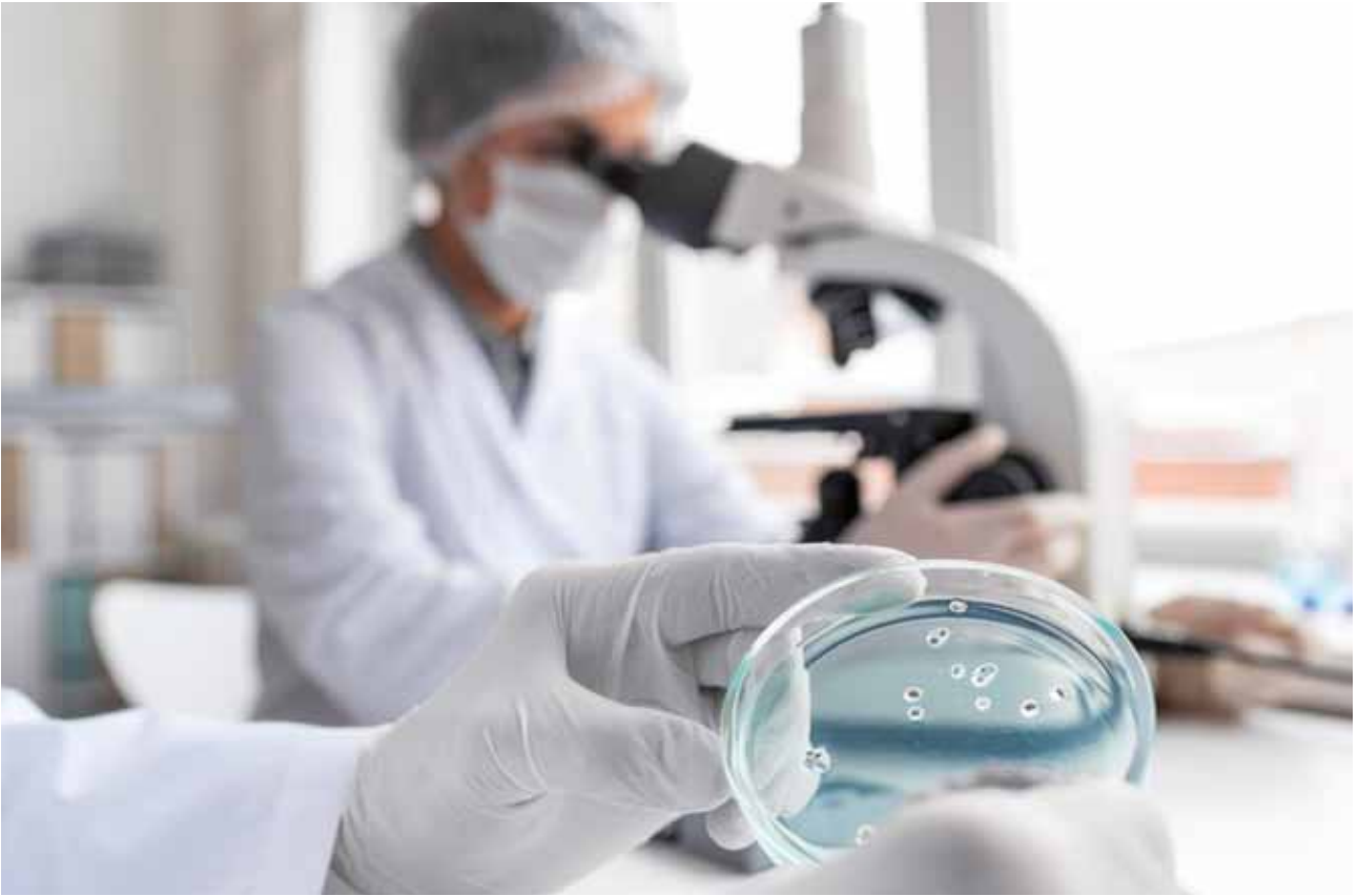
Figura 1: Análisis de muestras biológicas en laboratorio.